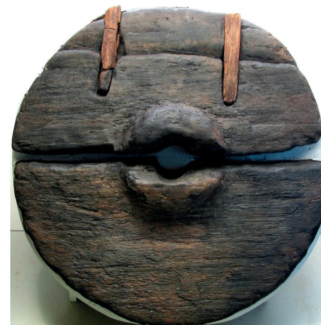
Skivehjul fra bondestenalderen - en gammel type hjul, som kan have været med til at slide hulvejene i skrænterne i Røverdalen

Ny Holstebrovej er det gamle navn for den nuværende hovedvej - rute 16. Vejen blev anlagt som en stenbygget vej i perioden 1855-1857 af ingeniør E.M. Dalgas – Hedeselskabets senere stifter.